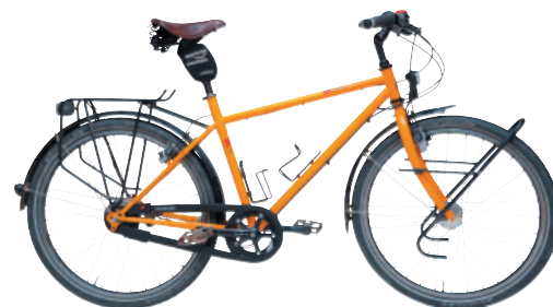
VSF Fahrrad Manufaktur T400 Rohloff