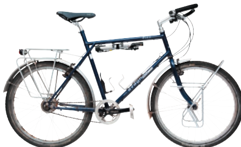
Avaghon S26.0 Rohloff