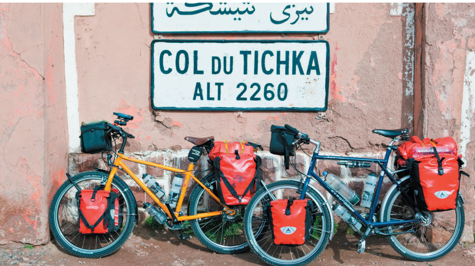
Natuurlijk misstaan deze fietsen niet in de Nederlandse polder. Het meest in hun element echter zijn ze tijdens verre reizen. Dan tonen ze hun ware aard.

Om de zware fietstassen mee te nemen zijn beide fietsen voorzien van stalen Tubus-achterdragers. De voordrager op de Avaghon is standaard gemonteerd, bij de VSF is deze als extra optie los verkrijgbaar. Alle nokjes zijn gewoon aanwezig, er is zelfs de mogelijkheid om een Tubus Duo te monteren. Om te genieten van het uitzicht, het eten van een broodje of het maken van een foto is het handig om de fiets te kunnen parkeren op een standaard. Dit gaat bij de Avaghon niet echt makkelijk: de standaard zit in het midden achter de trapas aan het frame vast. Dat levert niet alleen een tamelijk onstabiele 'parkeerstand' op, maar is ook vervelend omdat je altijd met de neus van je schoen tegen de schakelkabels van de Rohloff-naaf aankomt op het moment dat je de standaard uitklapt. De standaard op de VSF zit gemonteerd aan het eind van de liggende achtervork. Dat levert een duidelijk meer stabiele parkeerstand op. Als de omgeving zo mooi is dat je de tijd helemaal vergeet en de schemering haar intrede doet (of als die klim toch veel langer duurt dan je gedacht had), is dat voor berijders van de VSF T400 geen probleem. Deze fiets is standaard uitgerust met een SON-naafdynamo; vanwege het hoge rendement en de uiterst lage weerstand is het geen straf om met deze dynamo door te fietsen in het donker! Geen dynamo op de Avaghon. Wie licht wil moet een koplamp op batterijen aanschaffen. Achter op de bagagedrager zit standaard een Basta batterijlamp.